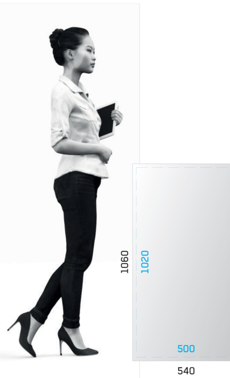
FRONT SAMBA FRONT SAMBA