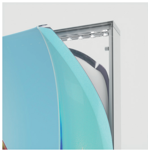
LB= Textil Durchlicht bedruckt LB= Textile backlite printed

Damit du deine Drucke pünktlich und in optimaler Qualität erhältst, ist es wichtig, dass du die Druckdateien richtig anlegst und benennst. Bitte beachte dazu folgende Informationen.