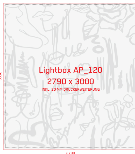
SICHTMASS + 20 MM DRUCKERWEITERUNG UMLAUFEND = DATEIGRÖSSE 2790 X 3000 TOTAL VISIBLE SIZE + 20 MM SURROUNDING PRINT EXTENSION = PRINT SIZE 2790 X 3000