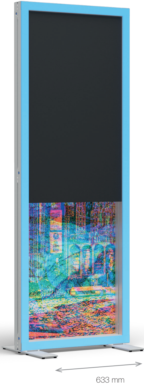
Vorderansicht Front view